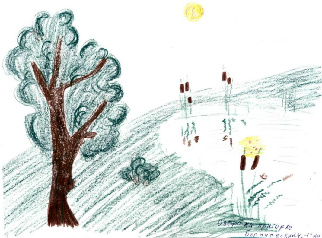
Возера на ўскрайку Белавежы Малюнак Барычэўскага Арцема, 4 «А» клас