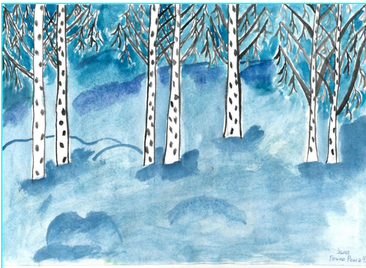
Зима в лесу Рисунок Грико Романа, 4 “А” класс