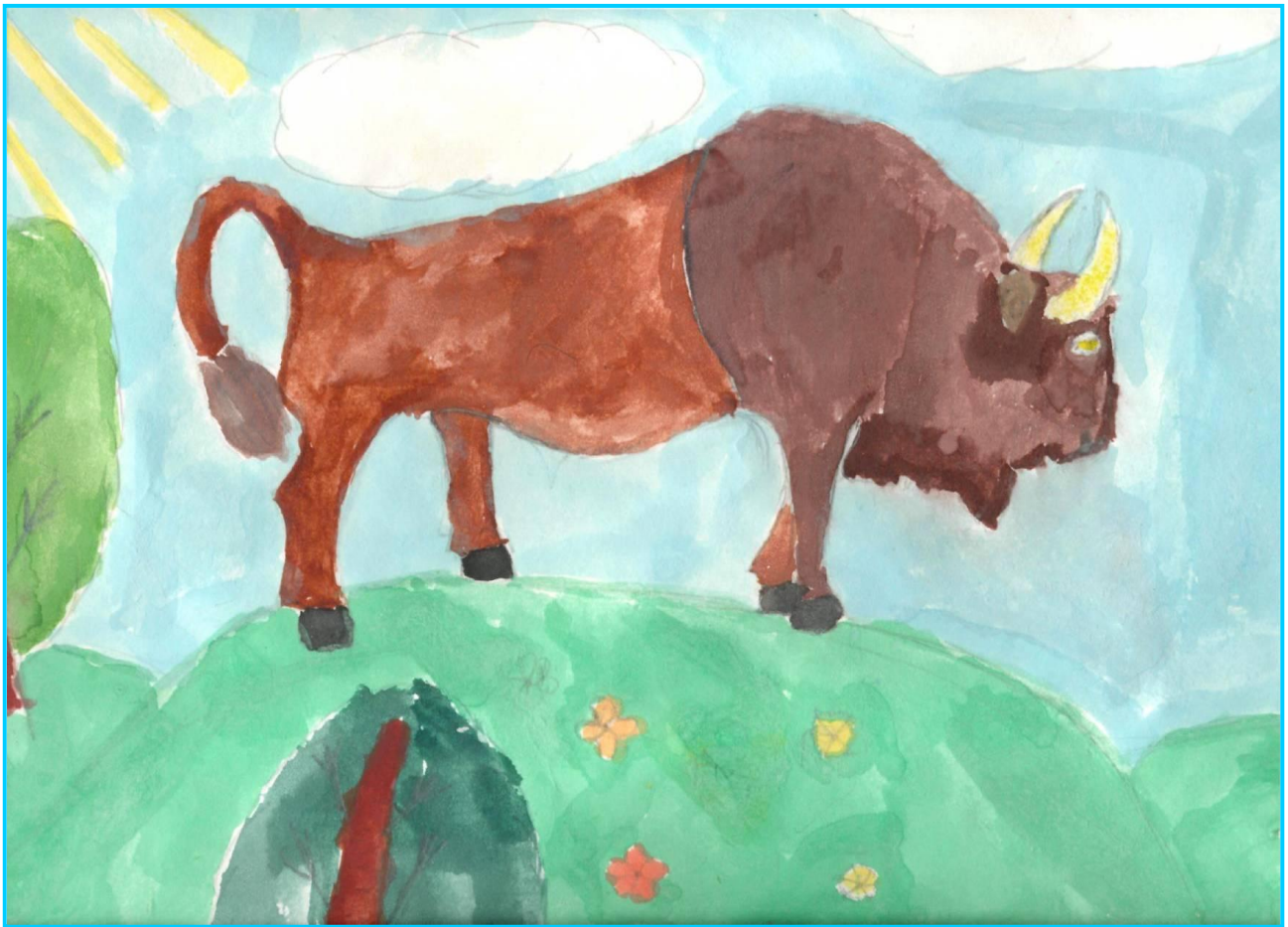
Беловежский зубр Рисунок Курбат Екатерины, 4 “А” клас