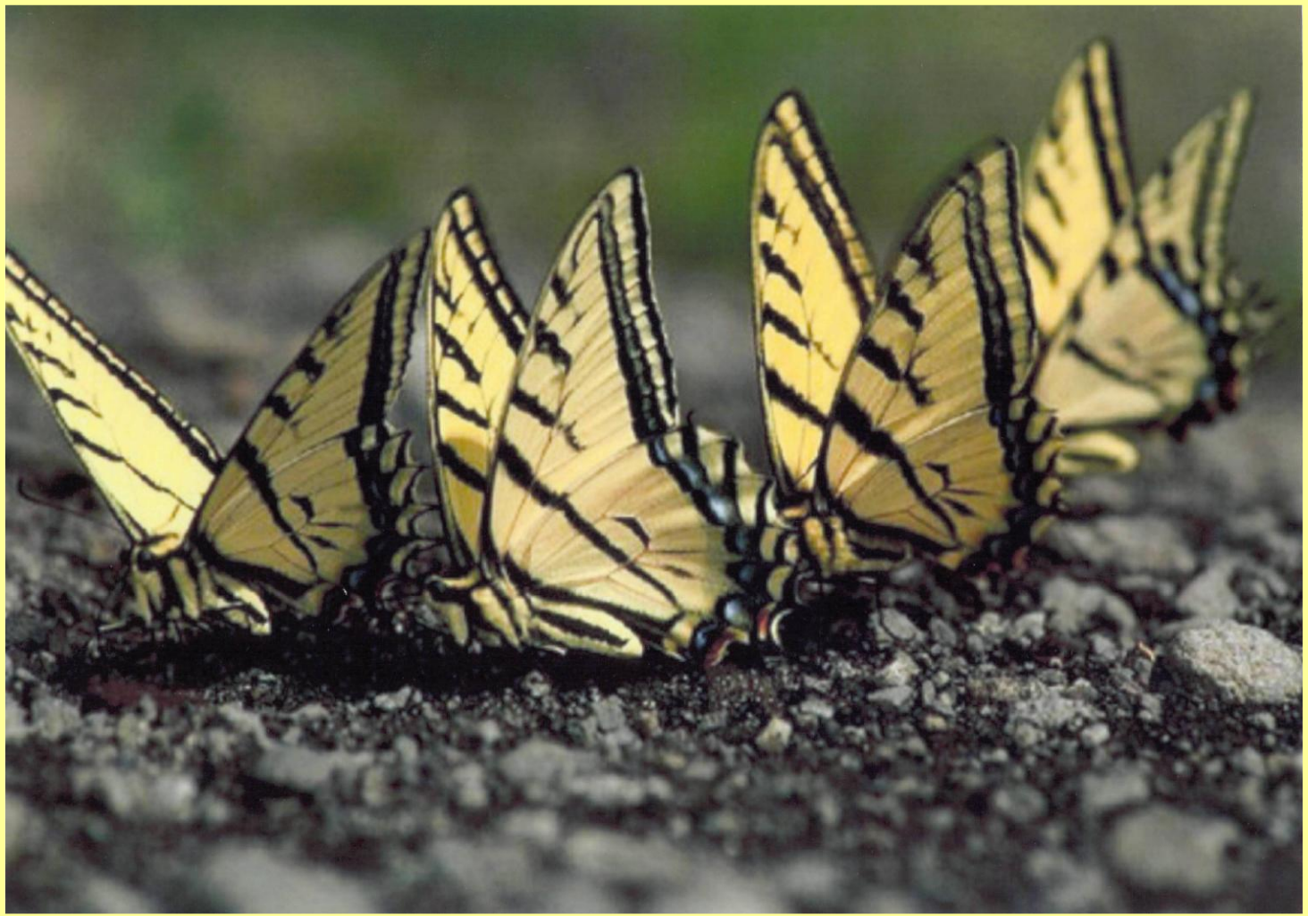
Весенний хоровод